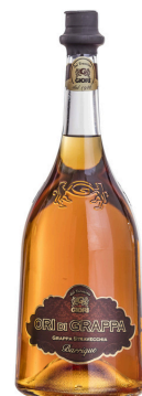
ORI DI GRAPPA STRAVECCHIA BARRIQUE