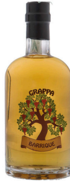
GRAPPA ANTICA RICETTA BARRIQUE