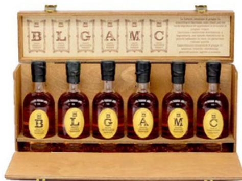
LO SCRIGNO DELLE LETTERE