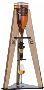
ESPOSITORE PER MAGNUM "Sin botella"