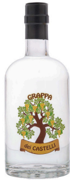
GRAPPA BIANCA DEI CASTELLI