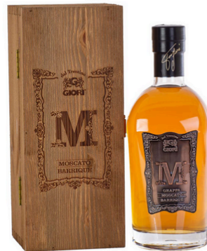
GRAPPA "M" MOSCATO BARRIQUE