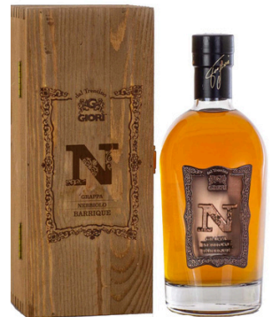
GRAPPA "N" NEBBIOLO BARRIQUE