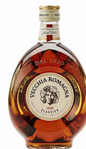
BRANDY VECCHIA ROMAGNA