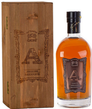
GRAPPA "A" AMARONE BARRIQUE