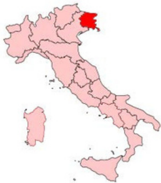
FRIULI VENEZIA GIULIA