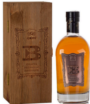
GRAPPA "B" BRUNELLO BARRIQUE