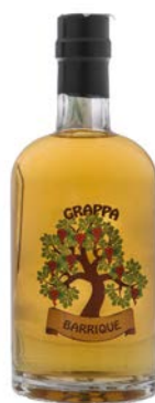
GRAPPA ANTICA RICETTA BARRIQUE