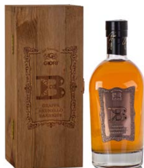
GRAPPA "B" BRUNELLO BARRIQUE