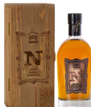
GRAPPA "N" NEBBIOLO BARRIQUE