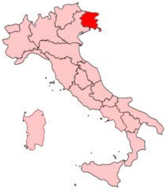
Friuli Venezia Giulia