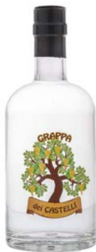
GRAPPA BIANCA DEI CASTELLI