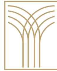
Santa Maria La Palma