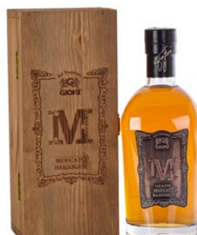
GRAPPA "M" MOSCATO BARRIQUE