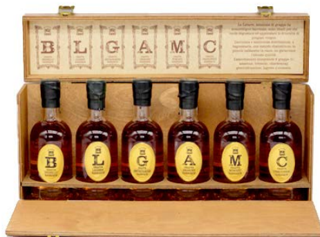
LO SCRIGNO DELLE LETTERE