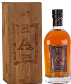
GRAPPA "A" AMARONE BARRIQUE